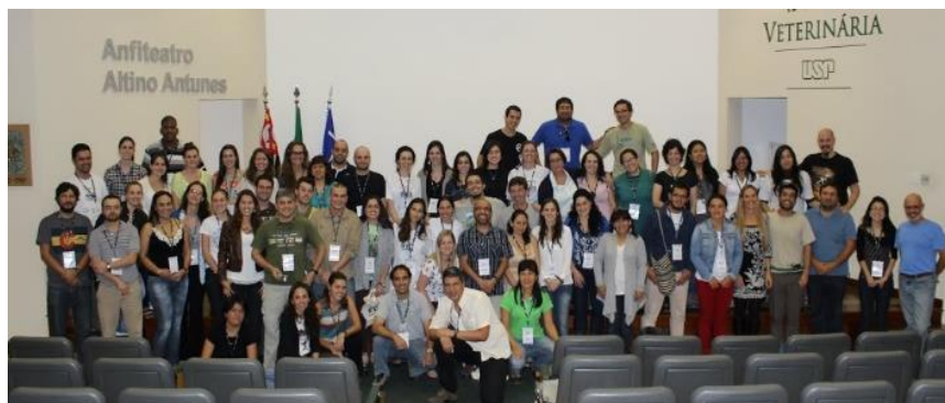
I Conferencia Bienal de la Sección Latinoamericana de la WDA, Sao Paulo, Brasil, 2013.

Para mayor información de nuestra sección visite el link: http://www.wdalatinamerica.org/?page_id=2